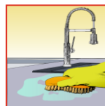
Mit Bürste durcharbeiten