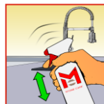
Vor Gebrauch gut schütteln