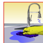
Mit klarem Wasser nachwaschen