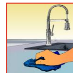
Mit trockenem Tuch kurz nachreiben