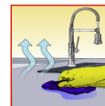
Aufnehmen und trocknen lassen

Zubehör-Empfehlung: Eimer, Bürste, Wischtuch, Schwamm.