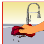
Grobe Schmutze trocken entfernen

HMK P303 Keramik Reinigungsspray Ergiebigkeit: ca. 40-60 m 2 /Liter (für innen und außen)